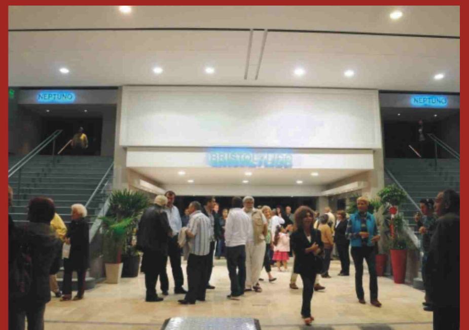
Frente del renovado complejo teatral.

Asimismo, en el mismo edificio, se realizó una puesta en valor de las tradicionales salas Lido y Neptuno, para atacar las necesidades que el paso del tiempo inevitablemente provocan.